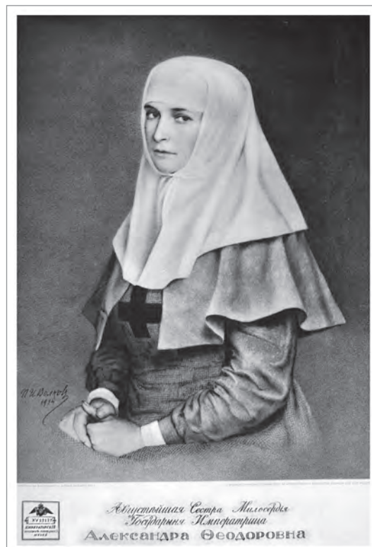
Портрет императрицы Александры Федоровны. 1914 г.

Развитию издательского дела зачастую препятствовали внутренние политические события. Непросто сложилась судьба у альбома «Русский Царь с Царицею на поклонении Московским Святеньям». Он посвящался поездке монаршей семьи в Москву на Пасхальные торжества весной 1903 года. Великолепно оформленное издание в комбинированном переплете, иллюстрированное множеством художественных портретов императорской четы и детей, увидело свет только через шесть лет после описываемых в нем событий. Выпустить книгу вовремя не удалось из-за кровавой смуты 1905—1907 годов. После Октябрьской революции большевики внесли ее в список контрреволюционных изданий и изъяли из всех библио-