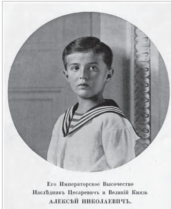
Портрет цесаревича Алексея Николаевича в матросском костюме. 1908 г.

торжественно отмечал свой 200-летний юбилей. 18 мая Императорский Мариинский театр давал 707-ю постановку оперы М.И. Глинки «Жизнь за царя».