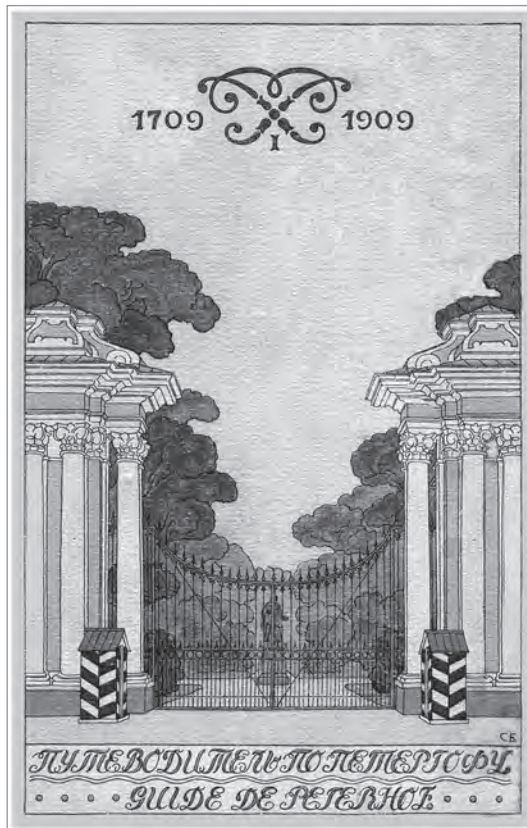
Обложка Путеводителя по Петергофу. К 200-летию Петергофа 1709—1909 = Guide de Peterhof (СПб.: товарищество Р. Голике и А. Вильборг, 1909)

В 1910 г. Товарищество «Р. Голике и А. Вильборг» выпустило книгу, вызвавшую неоднозначную реакцию столичной общности, — «Царское Село в царствование императрицы Елизаветы Петровны». В ее создании участвовал талантливейший живописец А.Н. Бенуа. Одни называли издание подлинным шедевром книжного искусства, а другие, не подвергая сомнению качество, критиковали издателей за баснословную цену. Стоимость действительно была высока (от 100 до 150 руб.), но зависела она от оформления переплета и сорта бумаги. Книгу украшали великолепные гелиографюры, фототипии, автотипии, а текст был напечатан оригинальным «елизаветинским» шрифтом. Роскошный том, как и подобает произведению искусства, оказался доступным лишь небольшому кругу состоятельных библиофилов. Книгу «Царское Село в царствование императрицы Елизаветы Петровны» неоднократно демонстрировали на различных выставках.