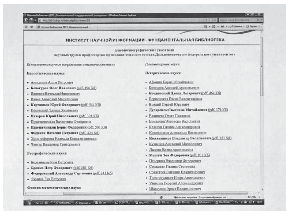
Рис. 1. Структура базы электронных библиографических указателей

Иногда идея с отбором кандидата приходит неожиданно, например, после прочтения какой-нибудь статьи. Так произошло с указателем О.И. Белогурова — одного из самых ярких преподавателей и ученых Дальневосточного государственного университета (ныне ДВФУ). После прочтения статьи, написанной благодарным учеником и посвященной его памяти, возникло желание сделать полнотекстовый указатель, тем самым отдав дань уважения этому человеку: «Для биолого-почвенного факультета ДВГУ 1990-е годы стали временем утрат: в течение семи лет ушли из жизни ведущие преподаватели... Но самой драматичной была безвременная кончина О.И. Белогурова, который с