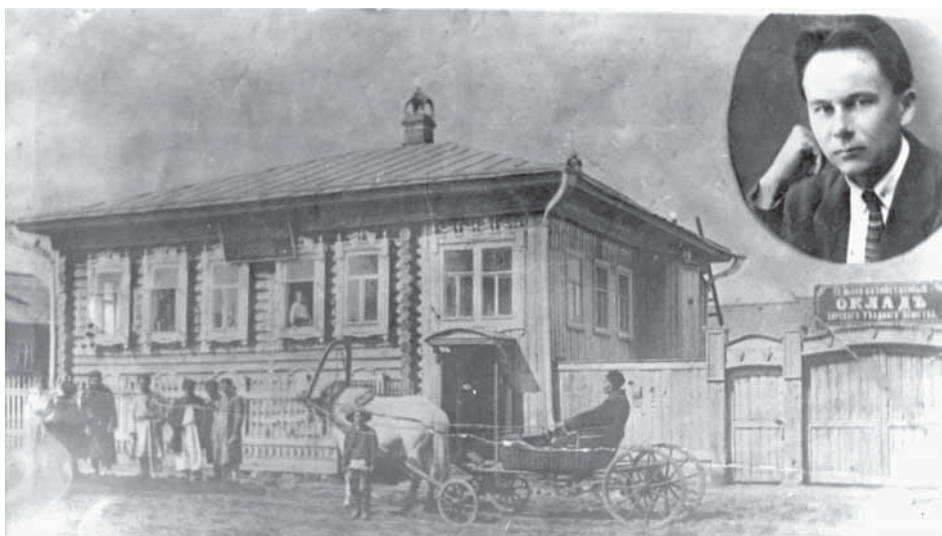
М.В. Амиров и здание Бураевской библиотеки-читальни. 1916—1917 гг.

Среди первых «иностранческих» библиотек, созданных губернским земством, были библиотеки