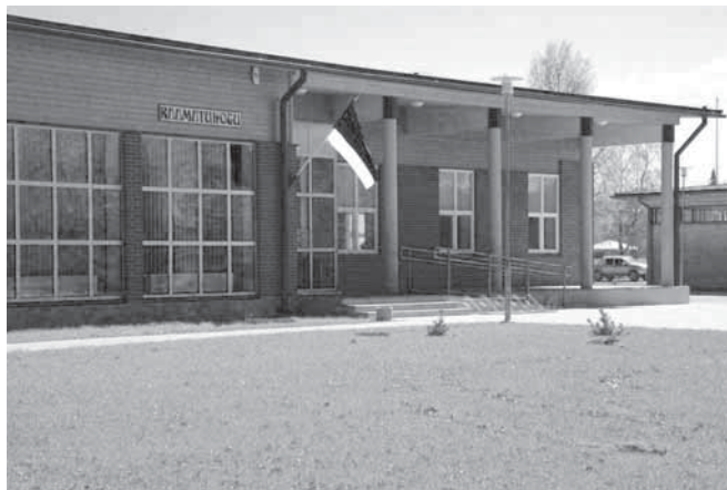
Библиотека в пос. Вяндра Пярнуского уезда

Комплектование новинок в библиотеках затормозилось, в первую очередь это касалось названий периодики и численности купленных экземпляров книг, зато активизировались МБА и докомплектование. Все библиотеки жаловались на то, что смогли купить новых книг меньше, чем в 2009 году. Причиной называли, главным образом, сокращение муниципальных бюджетов. Особенно сильно эта тенденция выражалась при комплектовании периодики, так как библиотеки часто стояли перед выбором — купить книгу или заказать журнал. Уменьшение названий и экземпляров периодики болезненно встречалось читателями. В целях улучшения обслуживания читателей все волостные библиотеки стали чаще согласовывать покупку литературы между собой, что позволило уменьшить экзemplярность комплектования. Модули книговыдачи по МБА