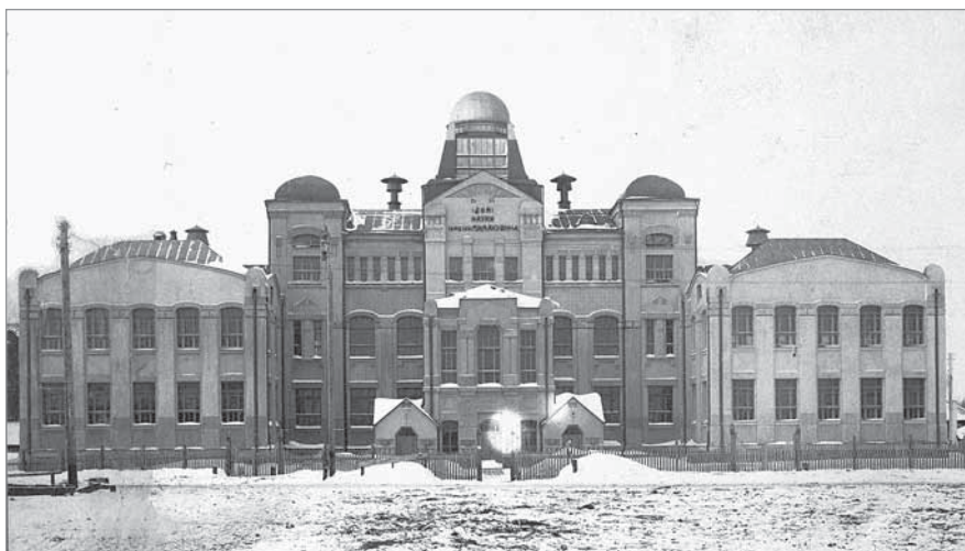
«Дом науки» (фото, б/д). Государственный архив Томской области. Ф. Р-1582. Оп. 1. Д. 31. Л. 2.

Изучение документов в Фонде № 3 (Томское губернское управление) ГАТО выявило удивительную халатность в работе канцелярии местного губернатора. Проект положения и письмо № 4844 на имя министра народного просвещения было ошибочно отправлено в Министерство внутренних дел (МВД). Спустя четыре месяца в канцелярию МВД было направлено прошение томского губернатора о пересылке ошибочно присланного письма и приложенных документов в Министерство народного просвещения [21]. По прошествии