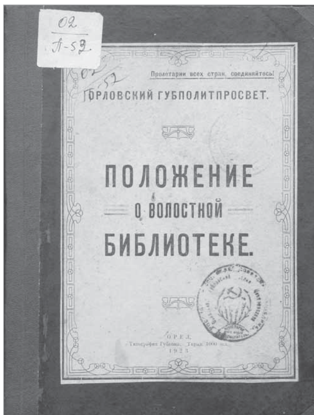
Рис. 1. Обложка издания [12]

Привлечение читателей «отдавалось всецело громкой читальне». Для чтения использовались, прежде всего, газеты, в которых отбирались наиболее интересные для местных жителей сведения и политически-руководящие статьи. Кроме газет для чтения советовалось брать научно-популярные книги и беллетристику, которые