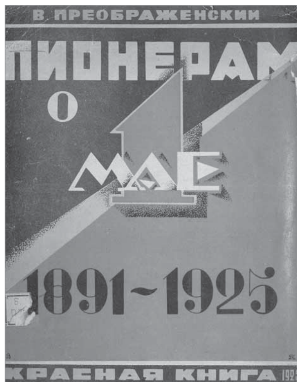
Рис. 3. Детские книги издательства «Красная книга» (Орел, 1925) [13; 14]

так как в волостной библиотеке среди книг, предназначенных для взрослых, можно было найти много подходящих для старших детей: классику, приключения и научно-популярную литературу. Беллетристику, предназначенную для детей других возрастов, подразделяли по темам, например: «Из крестьянского быта», «Жизнь детей», «Школьники и школа», «На заработках» и т. п.