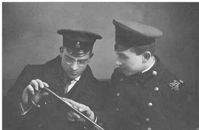
Рис. 1. Студенты Киевского политехнического института. Фотография (автор неизвестен). 1914, Киев. Политехнический музей Национального технического университета Украины. Источник: http://museum.kpi.ua/lib/kpi/uniform/