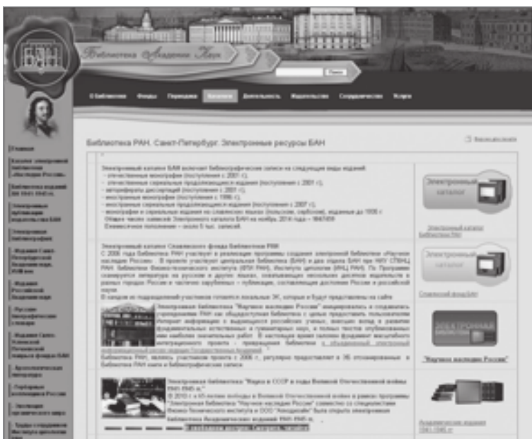
Страница сайта, раскрывающая электронный каталог БАН