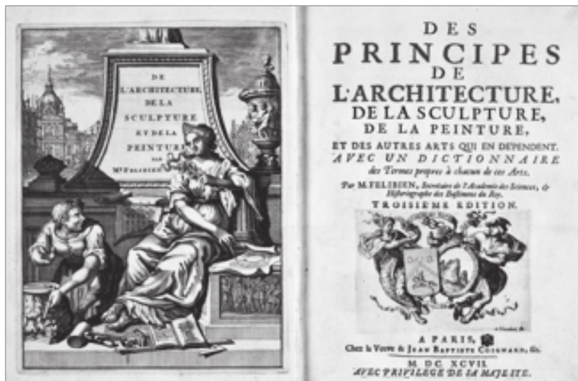
Félibien, André (1619—1695). Des principes de l'architecture, de la sculpture, de la peinture, et des autres arts qui en dependent (Paris, 1697). На титульном листе издания первоначальный штамп Библиотеки Академии наук