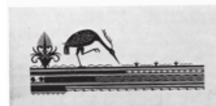
Шмуцтитул и заставки к поэме Гомера «Одиссея». 1935 г.

эме Гомера, воссоздав не только главные образы, но и основные эпизоды великого произведения мировой литературы. Эти с ювелирной тонкостью выполненные иллюстрации давно стали классикой книжного искусства XX века.