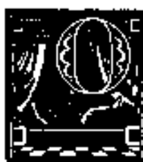
Буквицы из книги «Русская сказка». 1932 г.