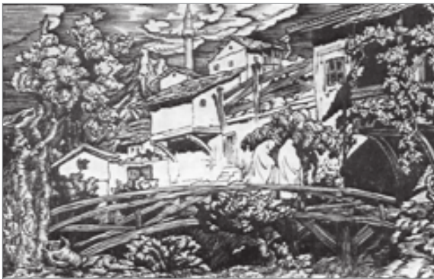
Восточный город. 1918 г.

ковая гравюра «Фортуна». В них был заметен недостаток опыта и мастерства, но уже в следующей гравюре на дереве, великолепном портрете выдающегося скульптора Теодора Залькалнса (1876—1972), художник проявил совершенно свободное владение новой для него техникой. Декоративная манера исполнения портрета не помешала Шиллинговскому добиться психологической тонкости и выразительности образа. В другой работе того времени — ксилографии «Восточный город» — штрих становится еще более упругим, а тонкая и изящная линия создает выразительнейшие узоры из деревьев, кустарников, травы, строений, неба, деревянного мостика на переднем плане. Богатство живописных соотношений создает впечатление воздушной среды и величавого бесконечного пространства.