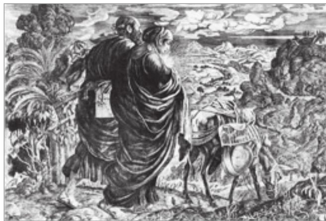
Бегство в Египет. 1914 г.