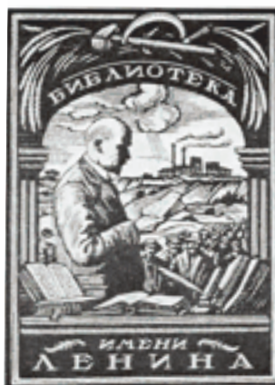
Книжный знак Библиотеки имени В.И. Ленина. 1925 г.

П.Е. Корнилова, красиво скомпонованы предметы, символизирующие изучение произведений искусства известным коллекционером, с аркадой-руиной и силуэтом петербургского пейзажа, столь любимого Шиллинговским. Для известного историка искусства Э.Ф. Голлербаха был выполнен экслибрис с изображением памятника А.С. Пушкина в Царском-Сельском парке. У подножия памятника — раскрытые свитки, книги с именами великих поэтов XIX—XX веков. Венчает экслибрис лента с надписью: «Отечество нам — Царское Село».