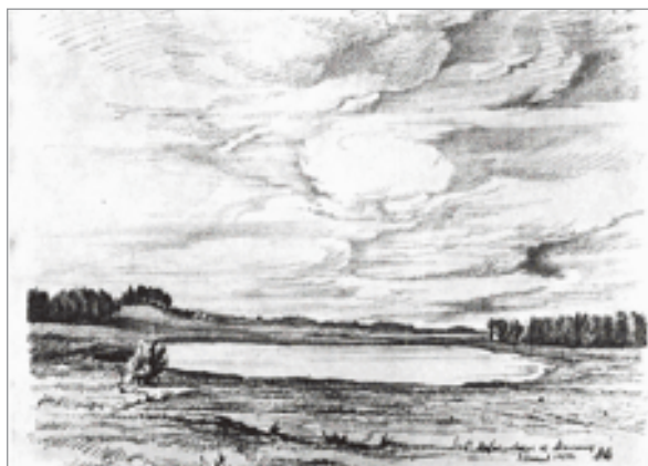
Село Михайловское. Литография. Из серии «Пушкинские места». 1924 г.