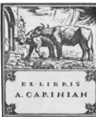
Книжные знаки А. Кариньяна. 1928 г.