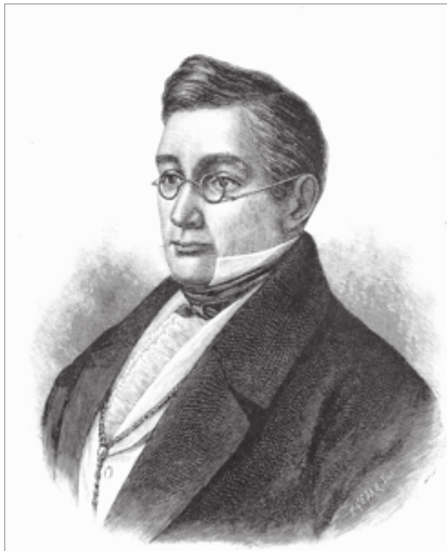
А.С. Грибоедов. Портрет, гравированный в Лейпциге Геданом