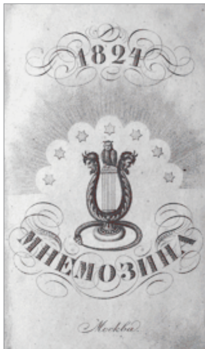
Альманах «Мнемозина». Фронтиспис

свои труды по изучению древнерусских памятников письменности — к сожалению, он погиб в расцвете сил и таланта.