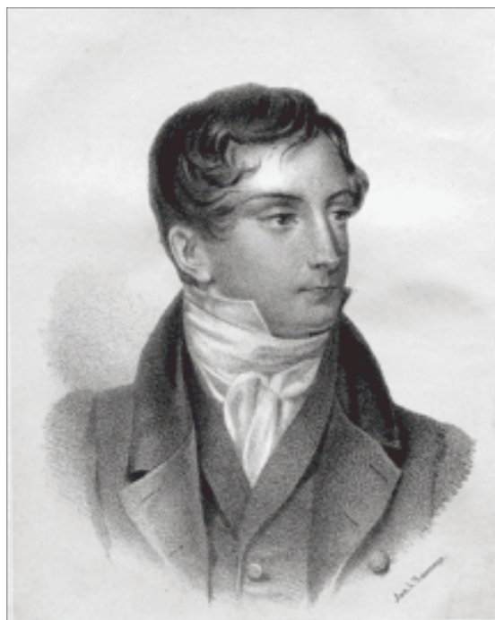
Д.В. Веневицинов. Литография А.М. Мюнстера с портрета П.Ф. Соколова. 1827 г.

В.Ф. Одоевский, который был моложе А.С. Грибоедова почти на 10 лет, вступал в пространство книжной культуры России на самом передовом ее направлении, и закономерны его знакомство, тесное сотрудничество и искренняя дружба со многими известнейшими литераторами, издателями, просветителями того времени. В 1822 г. он опубликовал в «Вестнике Европы» (журнале, основанном Н.М. Карамзиным, в котором в 1814 г. вышло первое стихотворение А.С. Пушкина «К другу стихотворцу») свой прозаический цикл «Письма к Лужницкому старцу», т. е. издателю «Вестника Европы» М.Т. Каченовскому 3 . А.П. Пятковский считал, что «Вестник Европы»