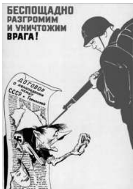
Худ. Кукрыниксы: М.В. Куприянов, П.Н. Крылов, Н.А. Соколов (М.; Л., 1941)