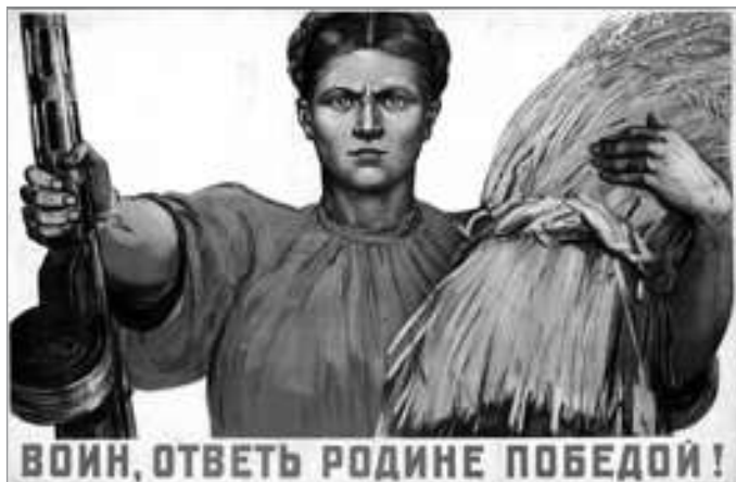
Худ. Д.А. Шмаринов (М.; Л., 1942)

Изображение женщины в русском народном костюме и