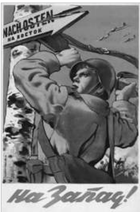
Худ. В.С. Иванов (М. ; Л., 1943)

Огромную популярность и любовь получил в годы войны плакат В. Корецкого «Воин Красной Армии, спаси!». Впервые опубликованный в газете «Правда» 5 августа 1942 г., он воспроизводился на многочисленных листовках, открытках, обложках журналов, конвертах — его общий тираж достиг 14 млн экземпляров. Позировали для