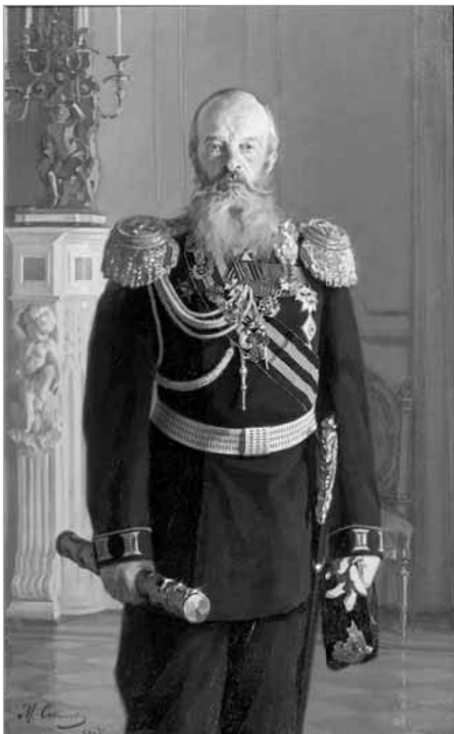
Рис. 2. Портрет великого князя Михаила Николаевича. М.Г. Соколов. 1907. Масло, холст. Государственный исторический музей.

«О военных училищах» (§ 1024, 1114. СВП 1914 г. [15, с. 195, 217]);