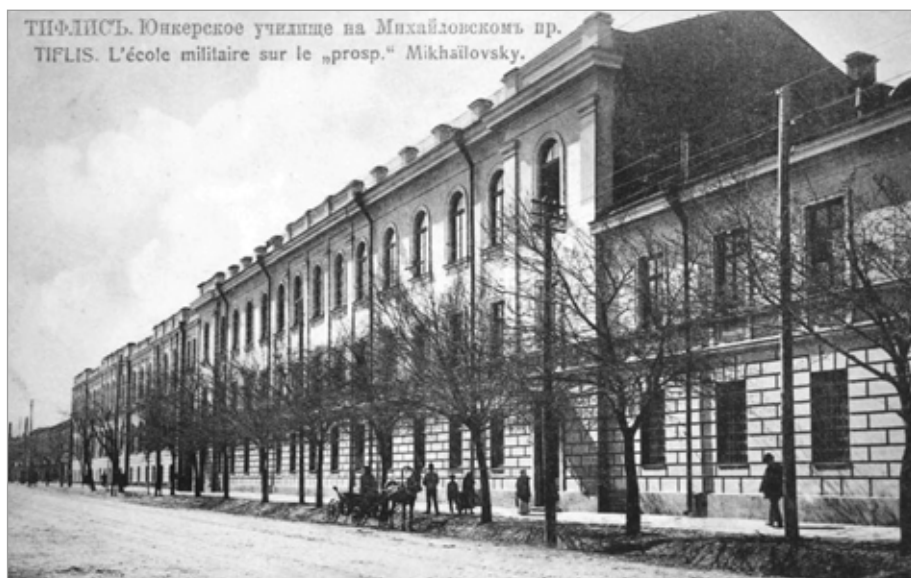
Рис. 1. Здания Тифлисского пехотного юнкерского училища. Фотография конца XIX века. Почтовая карточка