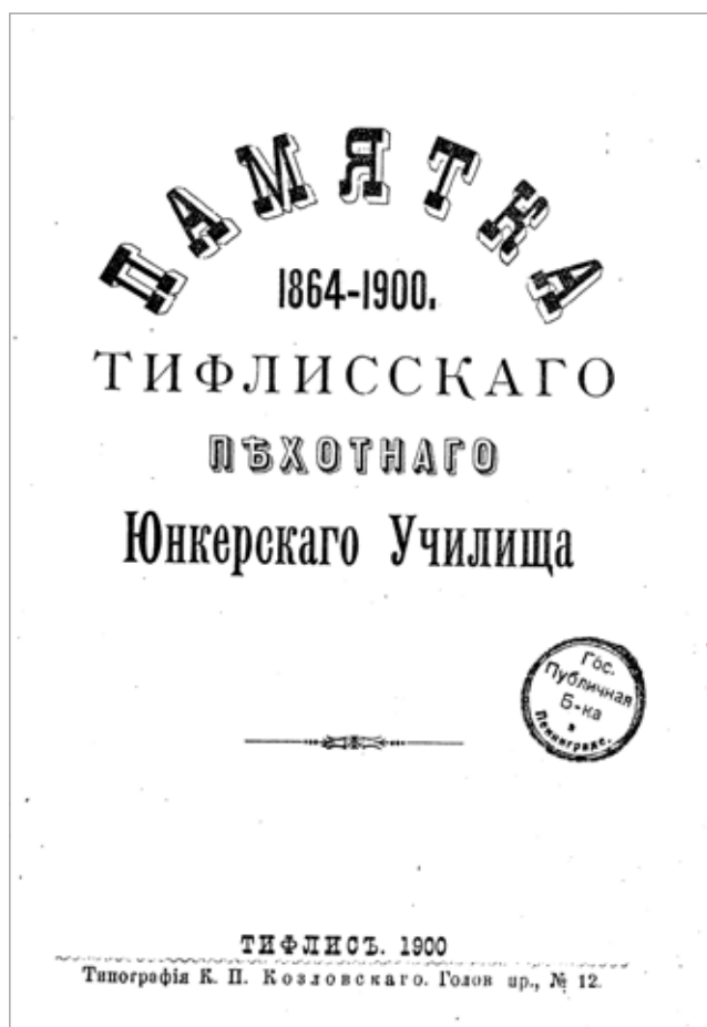
Рис. 3. Титульный лист издания [24]

(включая топографические планы для задач по листам) — всего пособий — 5501, пособий по тактике — 2740, экз. книг — 2761. Училище было на втором месте (после Казанского) из 16 юнкерских училищ по количеству учебников, пособий, книг в библиотеке: на одного штатного юнкера приходилось более 40 экземпляров. Книгообеспеченность в нем составляла 41 книгу на юнкера, в том числе учебников — 11,5; в Казанском училище — 41,6 и 11,1 соответственно [2, с. 474–476].