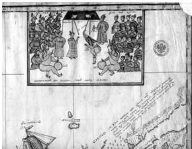
Камчатка. Цифровая копия фрагментов первой рукописной карты Камчатки, Алеутских островов и Аляски, составленной секунд-майором Т.И. Шмалевым. Дата создания оригинала 1775 г. В электронной копии представлены иллюстрированные фрагменты карты, изображающие быт аборигенов

Один из основных разделов в коллекции «Территория России» — раздел «Регионы России». В нем содержатся материалы краеведческого характера, отражающие историю, потенциал