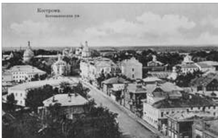
Кострома. Электронная репродукция почтовой карточки: Кострома. Богоявленская улица. Изд. книж. маг. Просвещение, [между 1909 и 1917]. 1 открытка : фотолитография. E.G.S.i.S. № 10566 4. Местонахождение: Из частного собрания. На бланке Всемирного почтового союза

В настоящее время на портале ПБ представлено 144 цифровые коллекции общим объемом более 42 тыс. ед. хр., 54 коллекции посвящены конкретным 51 региону. Несовпадение числа коллекций и числа регионов объясняется тем, что одному и тому региону может быть посвящено несколько коллекций. Отметим, что динамика создания подобных коллекций (см. диаграмму) на протяжении более чем пятилетнего периода обусловлена необходимостью информационной поддержки мероприятий, которые проводили органы государственной власти и непосредственно ПБ в регионах. Совокупный объем коллекций пока не велик, степень наполненности каждой конкретной коллекции различна, хотя при анализе библиотечной части электронного фонда выявляется 50—60% регионального контента 3 . Например, цифровая коллекция «Алтайский край» содержит всего 15 ед. хр., в то время как при поиске в электронном фонде выявляется более 300 документов библиотечного хранения. С точки зрения хронологии выделяются документы до 1917 г., затем документы первых лет Советской власти, период 1920—1930 гг. и далее. В «алтайском тематическом сегменте» достаточно широко представлена периодика, например «Алтайский сборник» (1898—1930), а также путеводители, двуязычные словари (русско-алтайские), отчеты статистических комитетов и др.