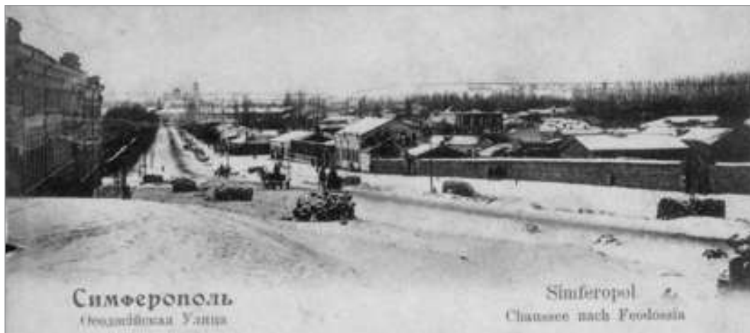
Симферополь. Электронная репродукция открытого письма: Симферополь. Феодосийская Улица [Изоматериал] = Simferopol. Chaussee nach Feodossia. Simferopol : Verlag A.K. Richter, [до 1904]. 1 открытка : фототипия. 3718. № 33. На бланке Всемирного почтового союза

Содержательно ЭБ структурируется по отраслям знаний, тематике (тематические коллекции) и типам документов. К последним относятся: электронные копии редких и ценных краеведческих и региональных документов, книжные издания, справочники и энциклопедии, статьи из сборников и журналов, периодические издания, аудио- и видеозаписи, малоизвестные архивные и музейные материалы.