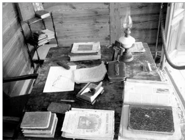
Экспозиция в музее Вышенского монастыря

Первоначально церковное попечительство с ходатайством об открытии библиотеки-читальни обратилось к митрополиту Московскому и Коломенскому Сергию (Ляпидевскому). Уже в конце 1897 г. состоялось собра-