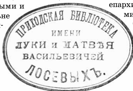
Штамп библиотеки Лосевых

Через несколько лет для церковно-приходской школы и библиотеки святителя Феофана было по-