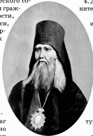
Автопортрет святителя Феофана, Затворника Вышенского

Внутреннее убранство комнаты, где находилась библиотека, описывает один из современников святителя: «Все четыре стены этой комнаты горизонтально, сверху до низу, разделены полками, которые сплошь заставлены книгами на разных языках (еврейском, древне- и новогреческом, латинском, французском, немецком, английском, славянском, русском). Большая часть книг богословского, нравоучительного и церковно-исторического содержания. Немало книг по истории гражданской, по философии, словесности, математике, архитектуре, живописи, медицине; есть географические карты, исторические атласы на разных языках, альбомы картин различных художников; масса духовных журналов; есть и светские иллюстрированные. Здесь же целые груды собственных сочинений преосвященного Феофана и масса его рукописей — более пяти стоп писанной бумаги. В этой же комнате стоит шкаф с письменными принадлежностями. Здесь же находится заваленный грудями бумаг рабочий стол епископа Феофана, но уже не на том месте, где он был при жизни работавшего на нем, — лестница для доставления с верхних полок нужных книг. На нескольких полках стены с западной стороны наставлено множество пузырьков, баночек, коробочек с лекарствами разного рода, которыми Владыка лечился сам и иногда лечил других. В этой же комнате оказалась фотографическая камера-обскура, телескоп, микроскоп, мольберт, несколько палитр, масляные краски, кисти и пр.» [3].