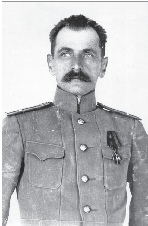
Портрет В.К. Арсеньева в форме подполковника. Ок. 1914 г.

Самые первые впечатления детства у Володи Арсеньева были связаны с книгами [4]. Они считались одним из немногих излишеств, которые могла позволить себе семья, и в Санкт-Петербурге у Арсеньевых была небольшая, но хорошо по-