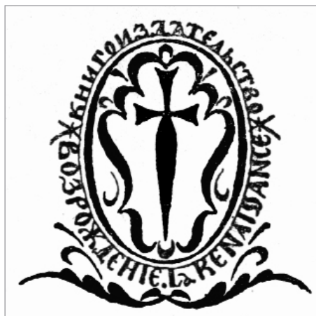
Издательский знак книгоиздательства «Возрождение»

Марку с крестом в виде меча создал извест-