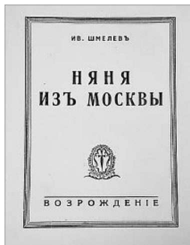
Обложка книги И.С. Шмелева

Писатель и драматург Илья Дмитриевич Сургучев (1881—1956) получил известность еще до Октябрьской революции 1917 г., был участником Гражданской войны, сотрудником «Освага», в эмиграции жил в Париже и работал в «Возрождении». Как коллаборационист в 1945 г. был даже приговорен к шестимесячному заключению. В 1952 г. он выпустил «ностальгический» роман «Ротонда», посвященный легендарному кафе на горе Монпарнас, где собиралась парижская богема и селились русские эмигранты. Большой интерес у читателей вызвало в 1953 г. издание книги «Детство императора Николая II». Это сборник рассказов о детстве последнего царя со слов его друга детства полковника