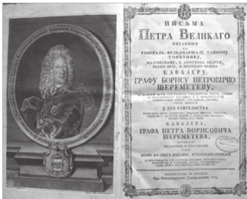
Фронтиспис, титульный лист издания «Письма Петра Великаго... графу Борису Петровичю Шереметеву...» (М., 1774)

вари, например «Лексикон трехязычный» (1704) с автографом А.В. Суворова на форзаце; Вейсман Э. «...Немецкий лексикон с латинским; преложенный на российский язык...» (СПб., 1782); Татищев В.Н. «Лексикон российской исторической, географической, политической...» (СПб., 1793).