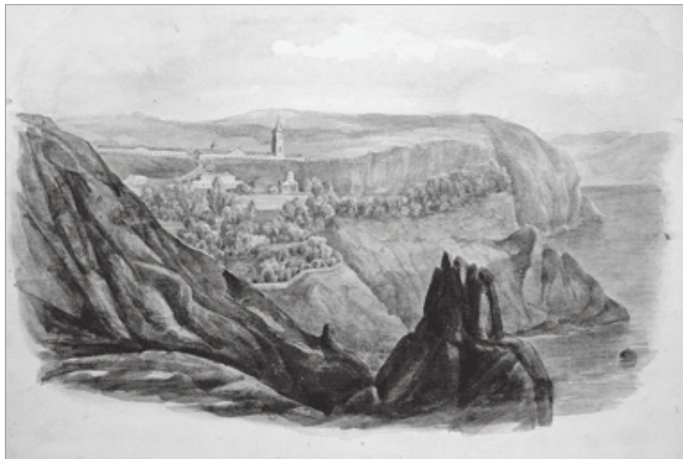
Балаклавский Свято-Георгиевский монастырь