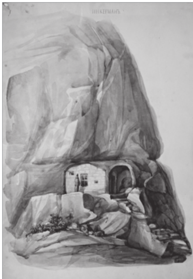
Инкерман. Вход в церковь Св. Климента