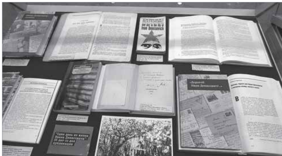
Экспонаты выставки «А.И. Солженицын. Человек. Писатель. Гражданин» (РНБ, ноябрь — декабрь 2017 г.). В центре — книга с автографом А.И. Солженицына