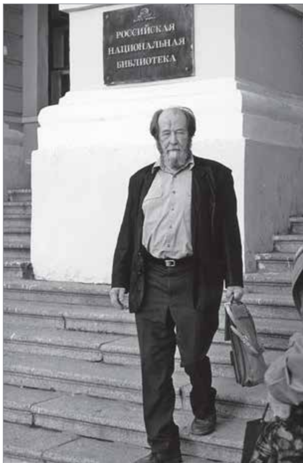
А.И. Солженицын во время визита в Российскую национальную библиотеку летом 1996 г.

Этот рассказ — первое опубликованное произведение писателя, принесшее ему мировую известность и повлиявшее, по мнению историков и литературоведов, на весь дальнейший ход истории СССР.