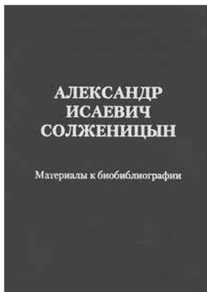
Обложка издания [1]

Сложности возникли при систематизации данных, так как у А.И. Солженицына имеется боль-