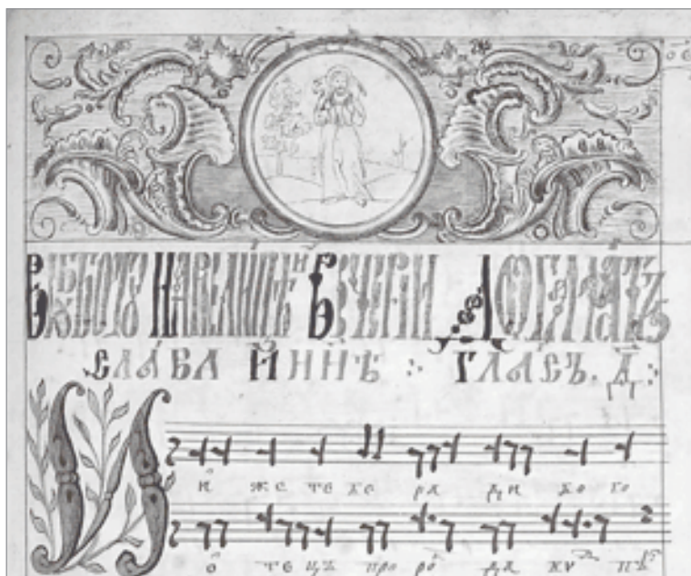
Ирмологион Ореста Софрониева. 1748 г. Заставка перед песнопениями 4-го гласа (НИОР РГБ. Ф. 304.1. № 456. Л. 75)

расширен по сравнению с крюковыми рукописями XVII века. Помимо традиционных стихир и славников Праздникам и тропарей часов Царских на Рождество Христово и Богоявление, книга включает в себя величания и припевы на 9-й песне, каноны, светильны, задостойники и причастны. Только состав самой ранней рукописи — двознаменника 1680-х гг. — традиционен для крюковых рукописей. Это Праздники полного состава: стихиры малой и великой вечерен (с литией), по 50-м псалме и на хвалитех; стихиры на целовании Воздвижению; тропари часов Царских Рождества Христова и Богоявления; тропари на водоосвящение Богоявления; стихиры на стиховне в Неделю Пятидесятницы вечер.