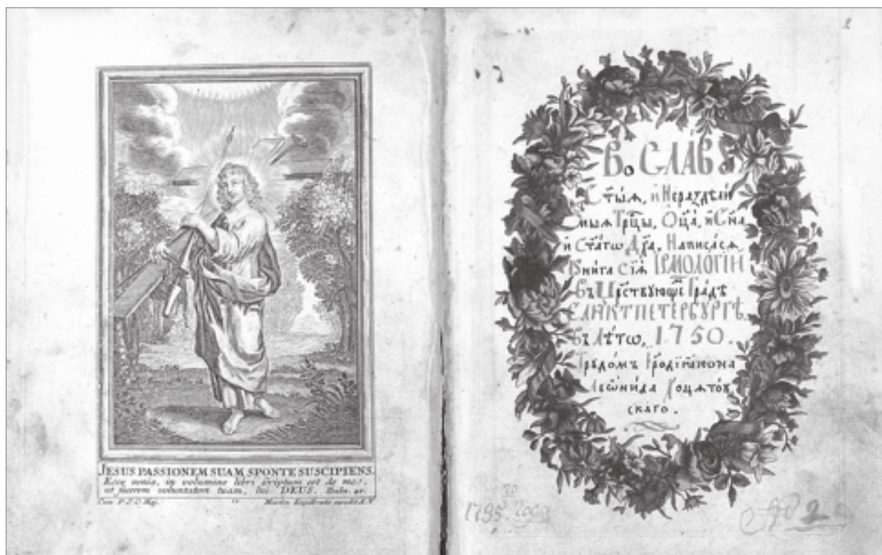
Гравюра Мартина Энгельбрехта и гравированный цветочный венок, открывающие Ирмологион Леонида Хоцятовского. 1750 г. (НИОР РГБ. Ф. 304.1. № 454. Л. 1 об.—2)

Нотолинейные Ирмологии, продолжая средневековую традицию, содержат ирмосы канонов, расположенные с 1-го по 8-й глас, с группировкой внутри гласа с 1-й по 9-ю песнь. Отличительная