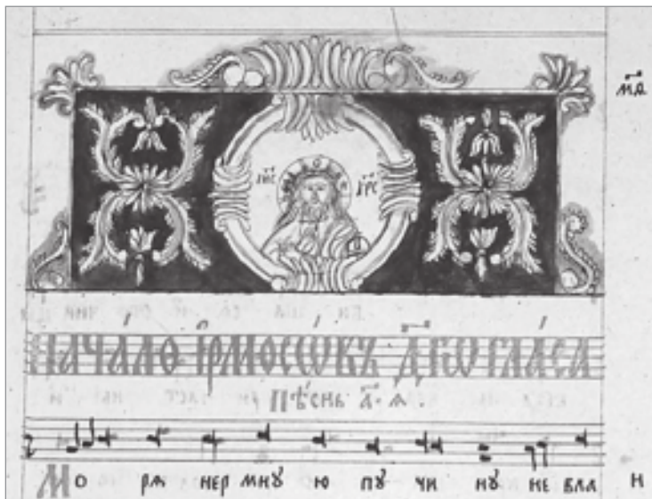
Ирмологий иеромонаха Ириная. 21 января 1827—1830 гг. Заставка перед ирмосами 4-го гласа (НИОР РГБ. Ф. 304.1. № 458. Л. 49)

Наместником лавры в 1743—1745 гг. был выпускник Киевской академии иеромонах Феодосий Янковский, до этого бывший игуменом Харьковского Ахтырского монастыря; в 1745—1748 гг. — архимандрит Иоасаф Горленко, сын полковника малороссийского Прилукского казачьего полка, назначенный в наместники по просьбе настоятеля лавры архиепископа Арсения Могиланского из Лубенского Мгарского монастыря Киевской епархии. Малороссиянин Феофан Чарнуцкий в 1744—1745 гг. являлся