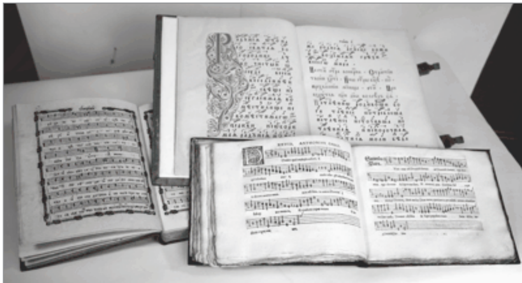
Образцы нотного письма Западной Европы (XVI в.) и России (кон. XVIII — нач. XX в.)

со специфическим печатным документом — нотами: их комплектовании, обработке, хранении, а кроме того, создании высокоэффективных условий для использования этого фонда читателями — музыкантами-специалистами и любителями музыки. В настоящее время собрание нотных изданий РГБ, универсальное по содержанию и составляющее свыше 400 тыс. ед. хр., является одним из