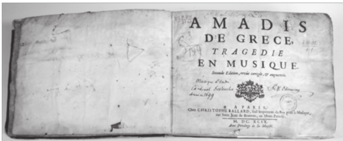
Ноты из коллекции князя В.Ф. Одоевского