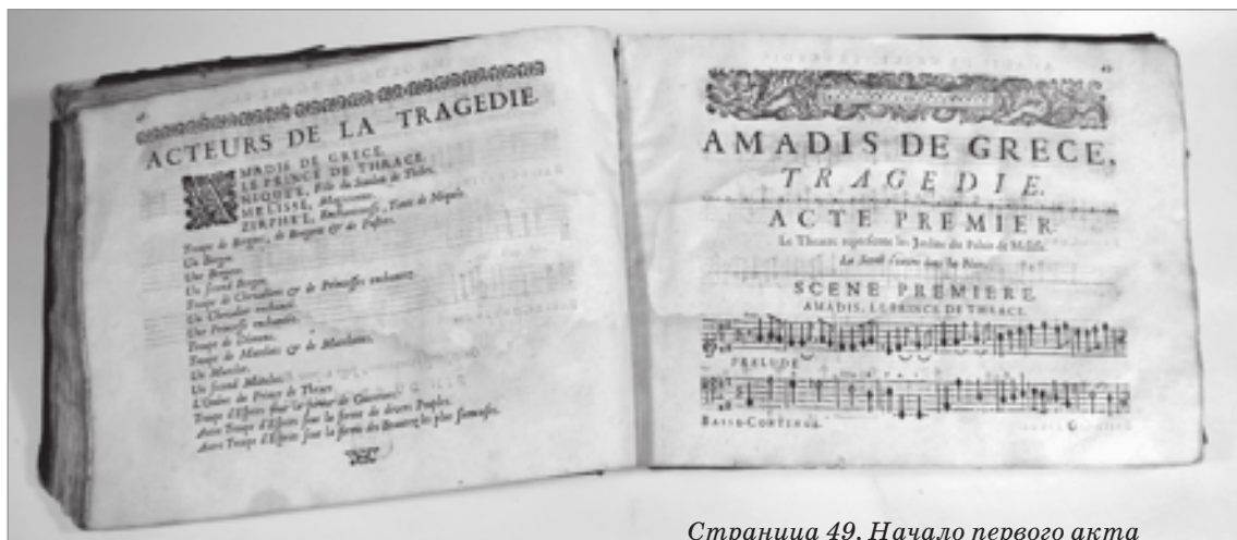
Страница 49. Начало первого акта

На титульном листе надпись В.Ф. Одоевского «Musique d'André Cardinal Destouches donné in 1699. Pr. W. Odoewsky»