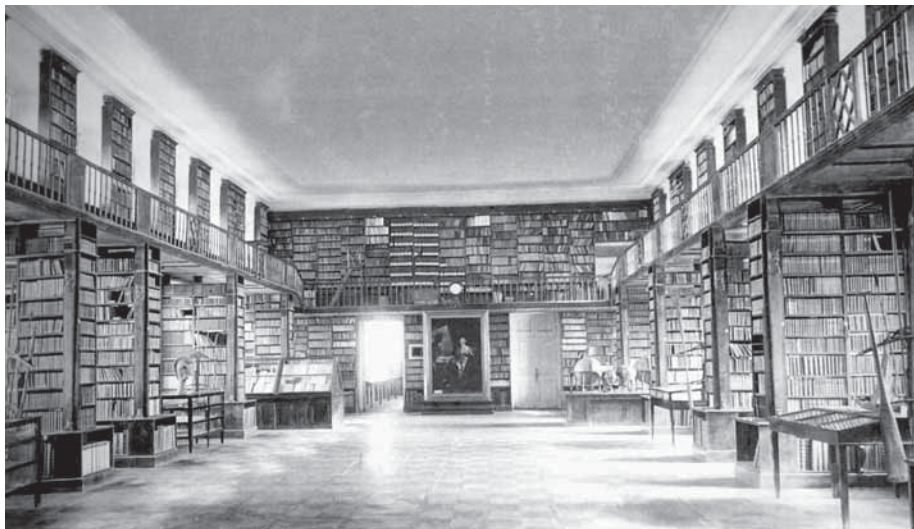
Румянцевский зал в Доме Пашкова

Особое место в череде выступлений на Румянцевских чтениях занял доклад, посвященный столетию Высших библиотечных курсов — ВБК (1913—2013 гг.), в котором был прослежен путь от становления библиотечного образования в предреволюционной России до сегодняшнего дня, со всеми его достижениями и некоторыми неудачами. Тема эта нашла продолжение на секции по управлению, где была дана детальная картина зарождения московской школы подготовки профессиональных библиотечных кадров.