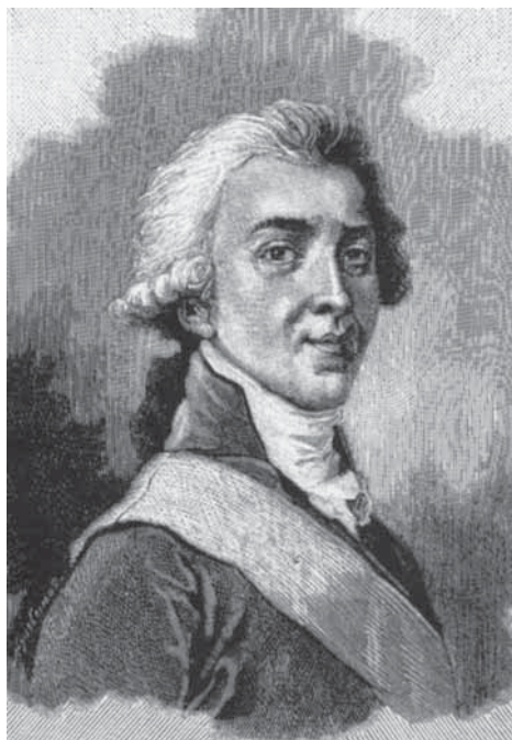
Н.П. Румянцева. Гравюра на дереве (XIX в.)

Юбилейный статус конференции определил направленность докладов и сообщений. Генеральный директор РГБ А.И. Вислый в своем выступлении на пленарном заседании отметил значение открытия читального зала для культурной жизни Москвы и москвичей.