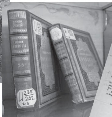
• Серия публикаций к 200-летию со дня рождения А.И. Герцена (1812—1870) и И.А. Гончарова (1812—1891)