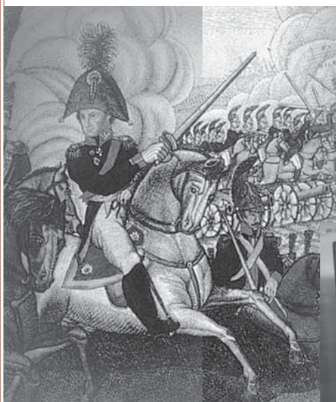
• «Священной памяти двенадцатого года...»: Отечественная война 1812 года. Эпоха в документах, воспоминаниях, иллюстрациях

От имени коллектива Парламентской библиотеки хочу выразить искреннюю признательность и благодарность всем, кто своим умом, талантом, знаниями и способностями регулярно дает жизнь новым номерам журнала и радуется своих читателей уважаемыми авторами, искрометными идеями, дискуссионными материалами, репортажами «с мест», передовым опытом лучших библиотек, обзорами профессиональных новинок. Счастья, успехов, творческих побед и свершений!