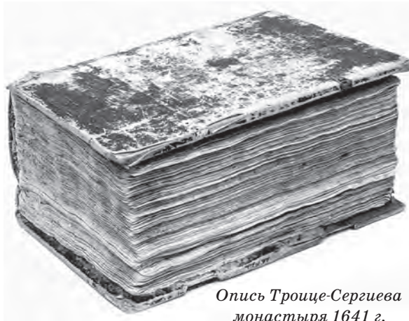
Опись Троице-Сергиева монастыря 1641 г. (СПГИХМЗ. № 289)