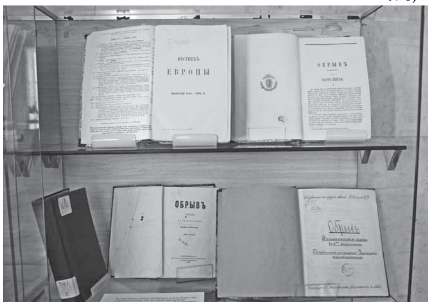
Первые публикации И.А. Гончарова

Отдельный раздел выставки посвящен изданиям собраний сочинений писателя, как прижизненным, так и первым пос-