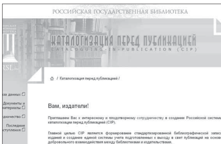
Страница Агентства «Каталогизация перед публикацией» на сайте РГБ