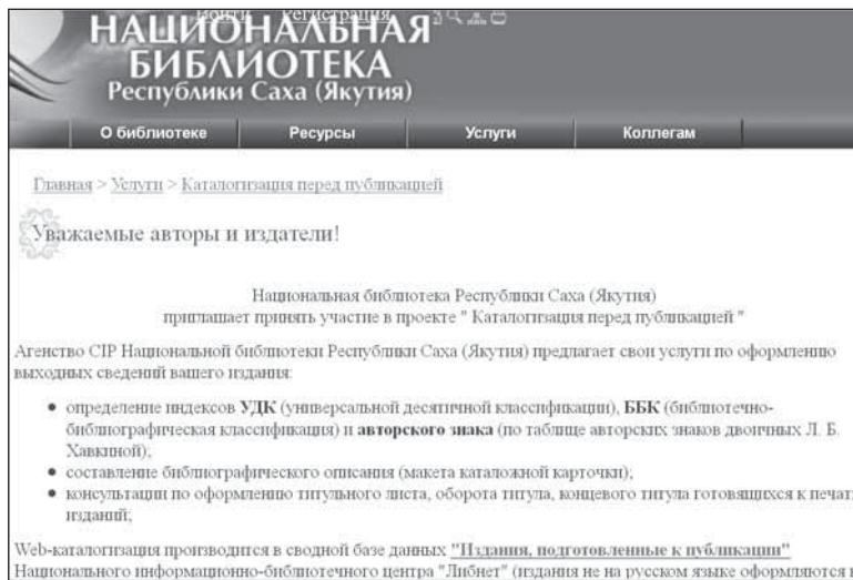
Страница Агентства «Каталогизация перед публикацией» на сайте НБ РС (Якутия)

Собранные данные обеспечивают явное доказательство ценности программ СІР, ежегодно объединенные усилия программ производят около 190 тыс. библиографических записей на 24 языках. Это означает, что библиотеки по всему миру обладают обширным ресурсом библиографических записей СІР, доступных библиотекам, продавцам книг и читателям за несколько недель до выхода издания в свет, они дают возможность заблаговременно пополнять фонды библиотек и, конечно, одновременно помогать издателям проводить рекламные акции, что способствует продаже книг до их выхода в свет [18].