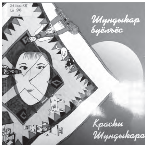
Обложка альбома «Краски Шундыкара» (2008)