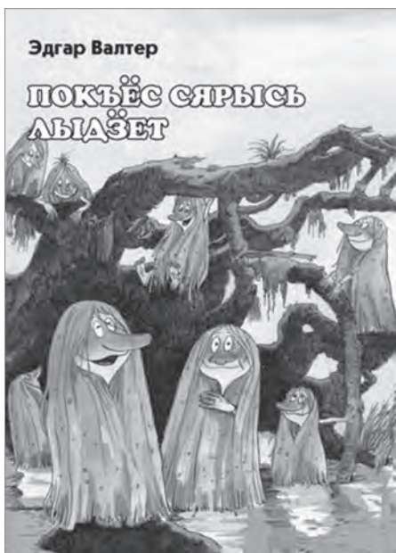
Переплет «Книги о поках» Э. Валтера (2010)

зультатом стало издание 21 учебного пособия для школьников на удмуртском языке общим тиражом более 2 тыс. экземпляров. Каждое пособие рассказывает об определенном районе УР: например, «Азбука Алнашского района», «Азбука Кизнерского района». Авторами стали местные краеведы, сельские учителя истории, географии, удмуртского языка, а также библиотекари. Специфика издания в том, что каждая буква сопровождается или стихами удмуртских детских писателей, или пословицей, или загадкой. Однако, на наш взгляд, азбука построена немного нелогично и цель издания не достигнута. Весь материал расположен по алфавиту, однако какой-то особенной информации, которая бы отличала один район от другого, немного. Названия населенных пунктов перечисляются без информационных справок; известные люди районов (писатели, композиторы, ученые и т. д.) указаны не все; животные и растения повторяются в каждой книжке. Нет информации об истории и достопримечательностях каждого района, отсутствуют карты и гербы, что обогатило бы материал. Немногочисленные черно-белые иллюстрации низкого качества также снижают достоинства изданий. Интересная идея, к сожалению, не получила достойного воплощения.