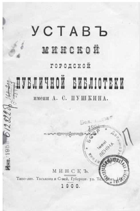
Титульный лист Устава Минской городской публичной библиотеки

Первая же «общая приятельская библиотека» была организована витебской молодежью еще в 1840-х гг., но из-за финансовых трудностей она просуществовала всего шесть лет [26, с. 157]. Идея создания общественных публичных библиотек получила более широкое распространение в начале 1860-х годов. В это время открылась общественная библиотека в Новогрудке, молодежная библиотека в Ошмянах и других городах. В них преобладали польские и французские издания, приобреталась прогрессивная для того времени литература [5, с. 59]. После подавления восстания 1863—1864 гг. ряд общественных библиотек был закрыт, включая и Новогрудскую общественную библиотеку [2, с. 26]. Однако под влиянием общественности царские власти вынуждены были в конце 1860-х гг. пойти на предоставление некоторых демократических свобод, в том числе открытие публичных библиотек. Тем не менее за период с 1863 по 1880 г. в Беларуси было разрешено открыть только три библиотеки: в Минске, Витебске и Пинске [39, с. 31]. Чтобы не допустить распространения через библиотеки демократических идей, царское самодержавие