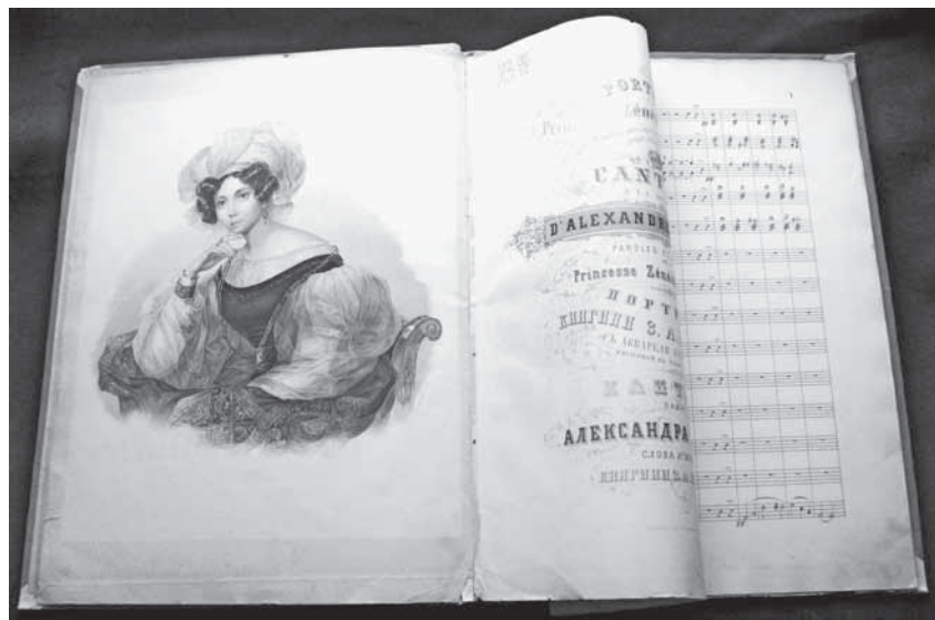
Волконская З.А. Кантата памяти Александра Первого: для хора с орк. (Б. м., [после 1862]. 29 с.) Портрет княгини Зинаиды Александровны Волконской с акварели К. Брюллова

Наличие просторных площадей позволило организовать несколько выставочных площадок. Кроме того, в отделе имеется свой камерный концертный