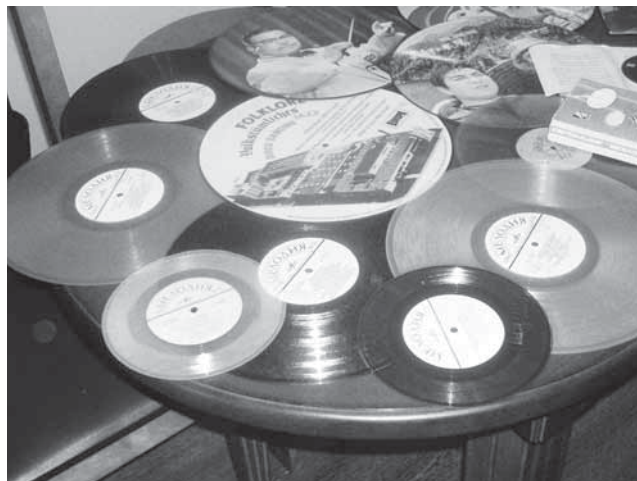
Грампластинки из фонда отдела нотных изданий и звукозаписей

На второй выставке — «От граммпластинки до mp3» (14 марта — 11 апреля) — впервые в истории Библиотеки была продемонстрирована история грамзаписи на примере хранящихся в фонотеке образцов. Здесь можно было увидеть коллекцию шеллаковых граммпластинок, записанных первыми дореволюционными российскими компаниями граммофонной пластинки «Граммфон», «Зонофон», «Артистотипия» и др., а также первые виниловые граммпластинки 1920—1930-х годов. Наиболее широко была представлена известная в XX в. фирма «Мелодия», производившая диски на