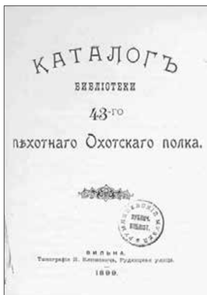
Титульный лист Каталога библиотеки 43-го пехотного Охотского полка [5]

Книгохранилище и гарнизонные библиотеки должны были содержать лишь военный отдел, а войсковые библиотеки — и бел-