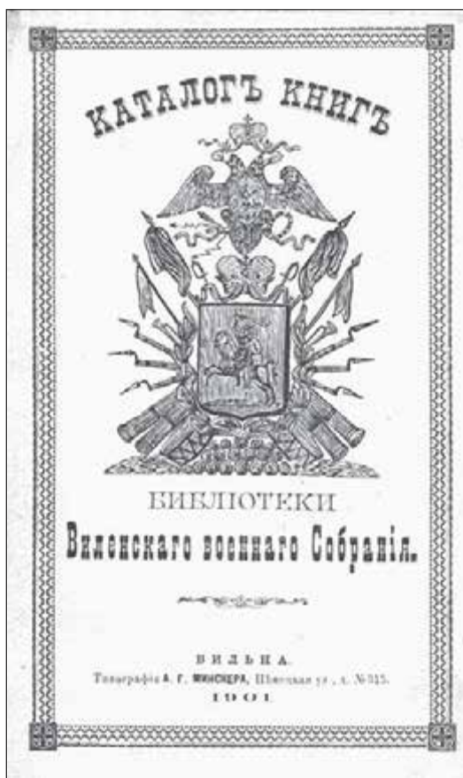
Титульный лист Каталога книг библиотеки Виленского военного собрания [9]

По завершении курсов офицерам-библиотекарям были выданы краткие «заповеди» для наилучшей постановки военно-библиотечного дела в воинских частях. Отчет о проведенных кур-