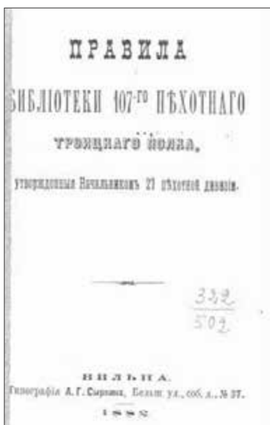
Титульный лист Правил библиотеки 107-го Троицкого пехотного полка [18]