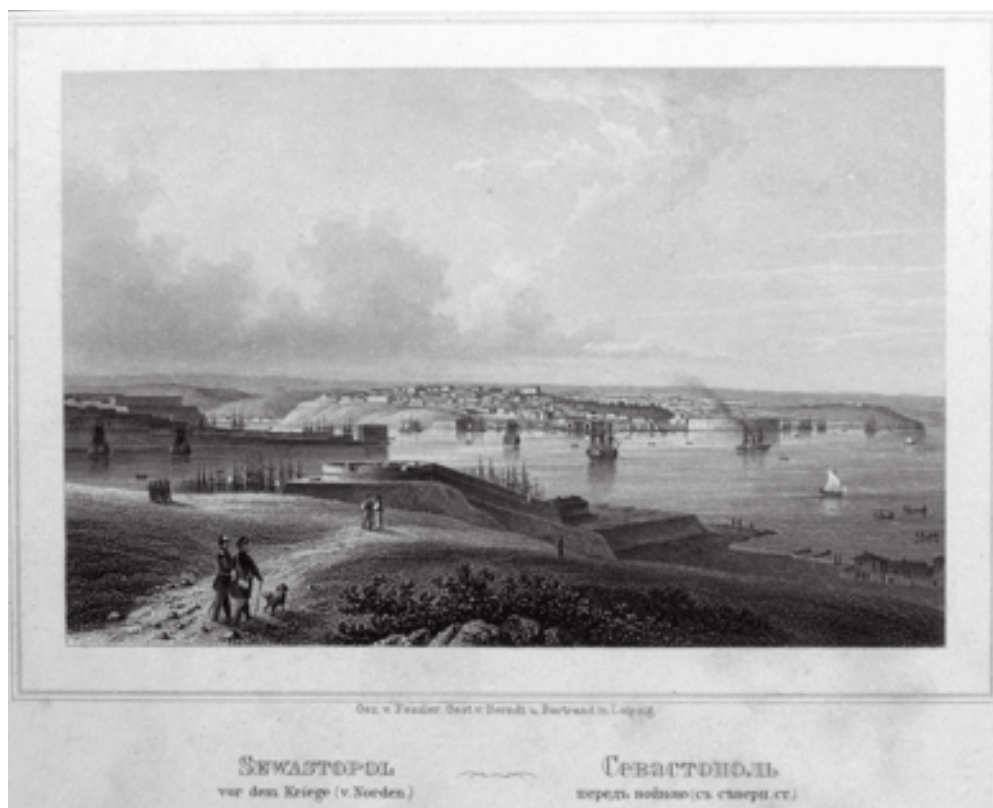
Берндт Ю. по оригиналу Фесслера А. Севастополь перед войною (с северной стороны). Гравюра на стали. Одесса: Изд-во Эмиля Берндта, 1869 г. Инв. № Гр. 22926

К сожалению, рамки статьи не позволяют представить все многообразие изобразительных материалов РГБИ, в которых нашли отражение