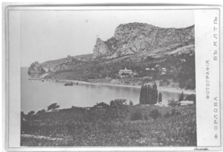
Орлов Ф.П. [Симеиз. Гора «Кошка»]. Фотография. Ялта, б/г. Инв. № 5415/6

Среди фотографий, хранящихся в РГБИ, особый интерес представляют сделанные В.Н. Сокорновым 6 , среди которых также есть дары А.А. Фомина (подробнее см. [2]). «Виды Крыма» — так сам фотограф определил свою