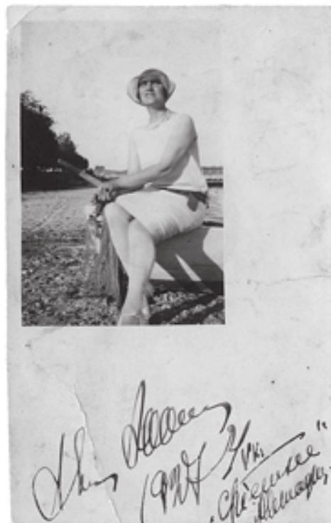
Актриса А.Г. Коонен на отдыхе в Крыму. Фотооткрытка. Крым, 1927 г. Инв. № Ф. 4193. Публикуется впервые

С темой Крыма связано и творчество основателя иллюстративного отдела РГБИ, художника П.П. Пашкова 8 (подробнее см. [8]). В живописи он обращался к разным жанрам, его привлекали сюжетные композиции, натюрморты, пейзажи, портреты. В фонде РГБИ хранится более тысячи его работ, в основном пейзажи и рисунки, часть из них относится к периоду 1920-х гг., когда художник путешествовал по Крыму.