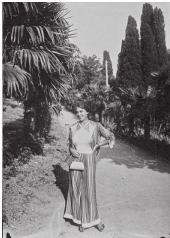
Кудрявцев А. [Молодая женщина на отдыхе в Алушке]. Фотография. Алушка, 1920-е гг. Инв. № 67255. Публикуется впервые

А какие приятные открытия ожидают нас, когда мы знакомимся с их авторами! Вот, например, фотооткрытка с портретом актрисы