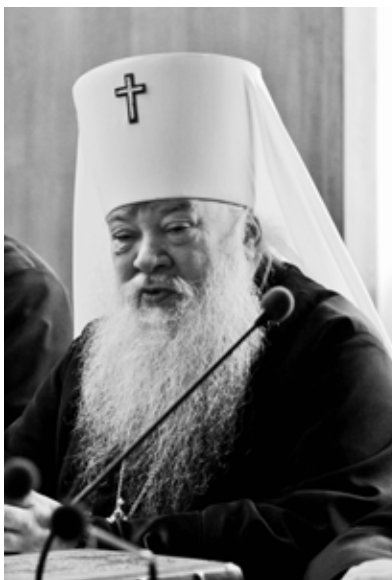
Митрополит Волынский и Луцкий Нифонт

Открыл презентацию В.В. Федоров, президент РГБ. Он отметил, что принимать делегацию, возглавляемую митрополитом Волынским и Луц-