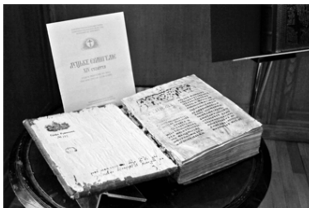
Луцкое Евангелие (НИОР РГБ. Ф. 256. № 112. Вторая пол. XIV в. Пергамен. 30,5×24,5 см. 262 л.)

Луцкое Евангелие (НИОР РГБ. Ф. 256. № 112. Вторая пол. XIV в. Пергамен. 30,5×24,5 см. 262 л.) — одна из древнейших сохранившихся до наших дней богослужебных книг Украины, относящаяся к памятникам галицко-волынской книгописной школы. Она представляет собой полный апракос — так называемое «Воскресное Евангелие», или «Богослужебное Евангелие», в котором текст расположен согласно воскресным церковным чтениям на подвижные и неподвижные праздники. Создано Луцкое Евангелие было в Свято-Преображенском или Красносельском монастыре близ Луцка во второй половине XIV века. Эпоха создания Луцкого Евангелия — это период жизни святых Сергия Радонежского и Дмитрия Донского, митрополитов Петра Ратенского, Феоноста, Киприана. Луцкое Евангелие написано на пергамене, переплет — доски в коже с золотым тиснением, тип письма — устав, имеются заставки, инициалы тератологического, растительного, геометрического типов. В рукописи содержатся записи, относящиеся к истории монастыря, где она была создана и хранилась. В научно-исследовательском отделе рукописей РГБ Евангелие находится в собрании основателя Румянцевского музея, Государственного канцлера России Н.П. Румянцева — мецената, исследователя и собирателя древностей. Рукопись в ходе