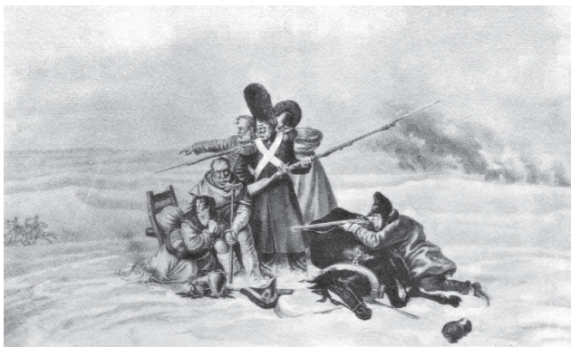
В окрестностях Бобра 23 ноября 1812 г. [Изоматериал]: [открытка] / [худож.] Фабер дю Фор Х.В. фон. — СПб.: Община Св. Евгении, [1911]. (Фототипия и тип. А.Ф. Дресслера). — 1 л. фототип.; 8,8×14 см. — Загл. и авт. парал. рус., фр.

чале XX в., порой малыми тиражами, они практически по дням воссоздают хронику событий тех героических лет, одновременно являясь своеобразной «родословной» воинских частей, раскрывающей их историю, кадровый состав и боевые традиции. К таким изданиям можно отнести исследование А.В. Висковатова «Историческое обозрение Лейб-Гвардии Измайловского полка. 1730—1850» (1851) богато иллюстрированное издание «История Лейб-Гвардии Павловского Полка. 1790—1890» (1890), и др. Являясь порой полиграфическими шедеврами того времени, эти