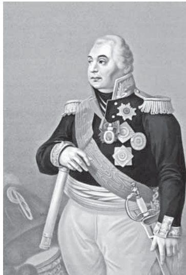
Князь генерал-фельдмаршал Михаил Илларионович Голенищев-Кутузов, главнокомандующий русской армией в 1812 г. [Изоматериал]: [лубок] М.: Литография Т-ва И.Д. Сытина, 1912

1812 г. нашел отражение и во многих архивных документах, хранящихся в НИО рукописей