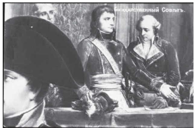
Государственный Совет [Изоматериал]: [открытка]. — [Paris], [1912]. — 1 л.: фотопечать; 8,9×14,1 см

Впервые на сайте широко и разносторонне представлены книги, составляющие историографию полков русской армии — участников сражений Отечественной войны 1812 г. и заграничных походов 1813—1814 годов. Изданные в XIX — на-