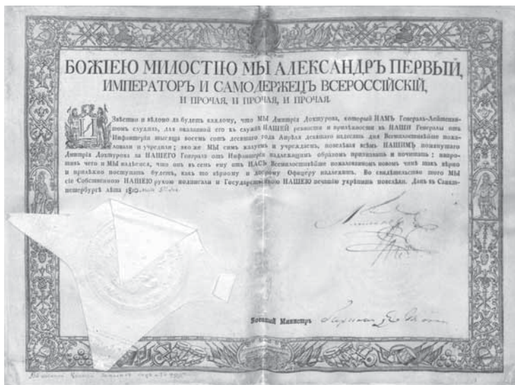
Дохтуров Д.С. Патент на чин генерала от инфантерии. 1810 мая 5. Печатный с орнаментальной рамкой и собственноручными подписями императора Александра I и военного министра Барклая-де-Толли. Пергамен, печать под кустодией. 1 л.

войны глазами современников, дать доступ к первоисточникам. Для того чтобы молодой читатель не утонул в обилии информации, на сайте предусмотрены «подсказки»: в разделе «Я пишу реферат» размещены одиннадцать библиографических списков литературы на темы, которые чаще всего изучают студенты и школьники; в разделе «Интересные факты» отобраны 56 цитат из книг и рукописей. Они касаются событий, предшествующих войне и произошедших во время боевых действий, взяты из воспоминаний русских и французских солдат и офицеров, описывают дей-