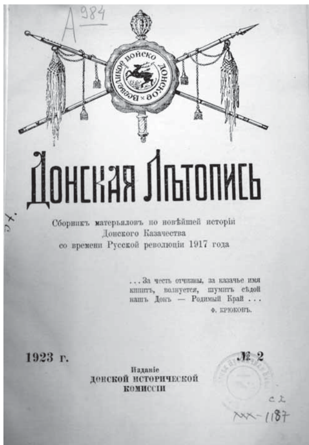
Титульный лист «Донской летописи»