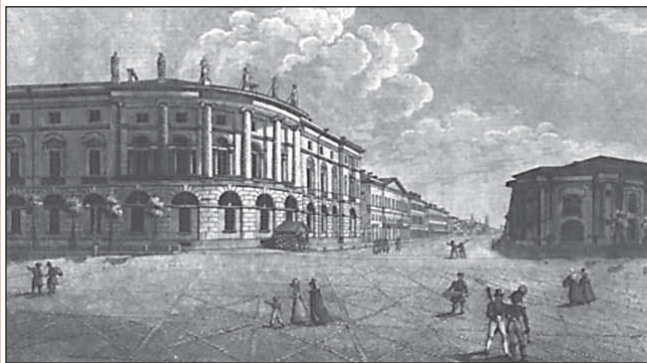
Императорская Публичная библиотека в Петербурге (середина XIX в.)

финансов являлась препятствием для дальнейшей научной деятельности. В феврале 1862 г. он подал в отставку, а в марте того же года поступил в Государственный архив, относящийся к ведомству Министерства иностранных дел, на должность старшего архивариуса. Одновременно он подал заявку на соискание должности адъюнкта Академии наук по Отделению русского языка и