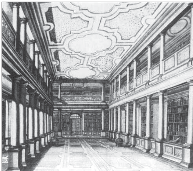
Библиотека Санкт-Петербургской Академии наук (середина XVIII в.)